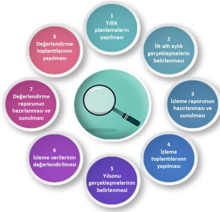
Şekil-4 İzleme ve Değerlendirme Süreci

İzleme ve değerlendirme sürecinin işleyişi ana hatları ile yukarıdaki şekilde özetlenmiştir.